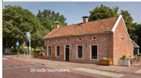
De oude Stelmakerij