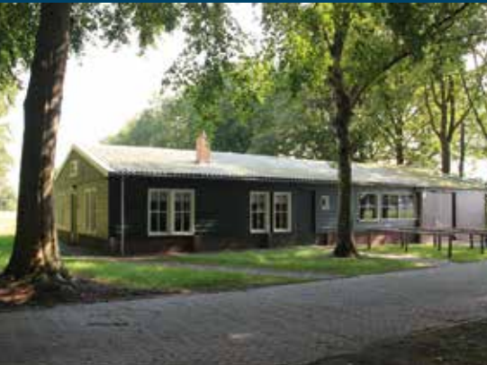
Kamp De Beetse, Sellingen