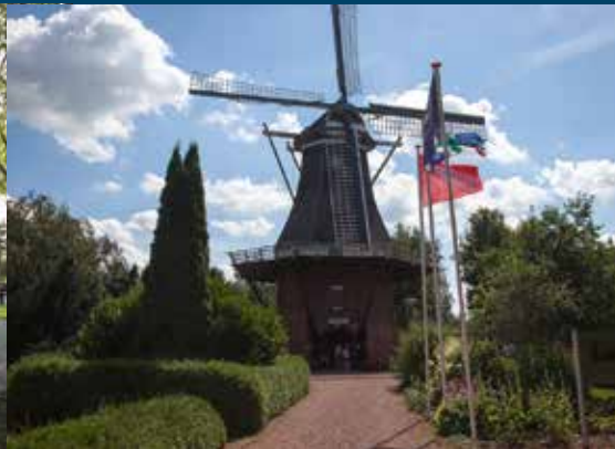
Molen de Korenbloem, Vriescheloo